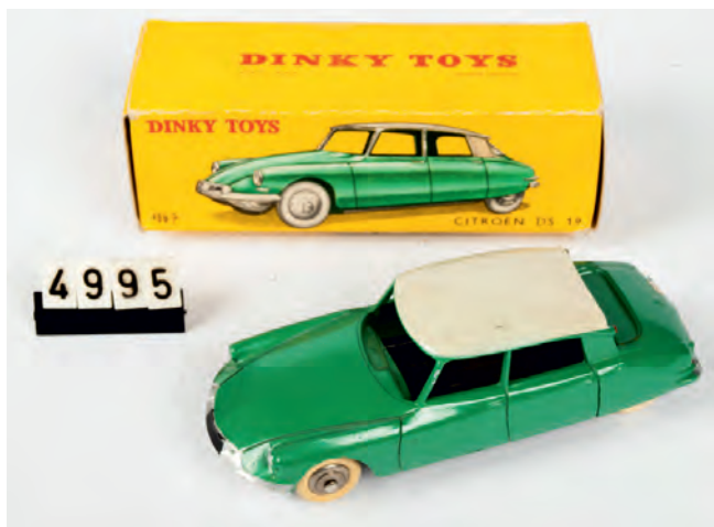
Nieuwe aanwinst Dinky Toys