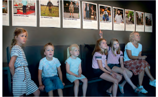
Voorde Kids activiteit

De kinderroute door de tentoonstelling 'Dit zijn wij!' - voor individuele kinderbezoeken - werd voor de opening van het nieuwe museum in 2019 ontwikkeld en werd