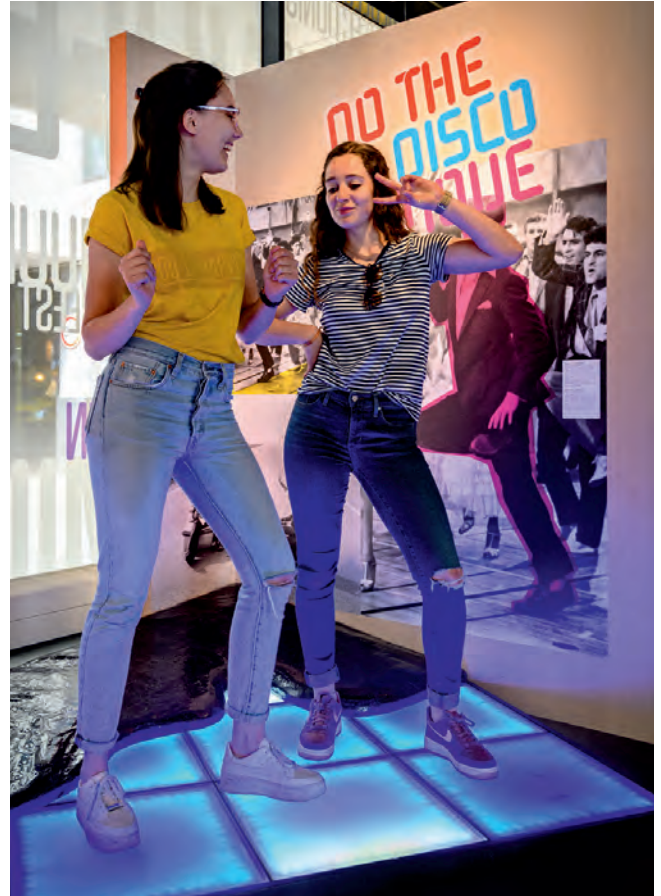
Discovloer in de tentoonstelling 'Dit zijn wij!'

In de semipermanente tentoonstelling '...en wie ben jij?' worden bezoekers aan de hand van zeven thema's aan het denken gezet over wat maakt wie we zijn. Thema's zijn: religie, politieke voorkeur, man-vrouwverhouding, klimaat, veiligheid, wonen en werken.