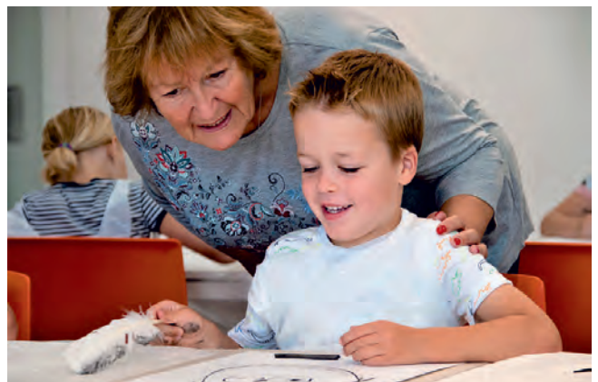
Museumles 'Stoer ben je Selfie!'

In het najaar werkte Museum De Voorde mee aan de Brede School activiteiten van de VVE-scholen van OPOZ. Het museum bood één lessenserie aan, getiteld 'Stoer ben je selfie!'