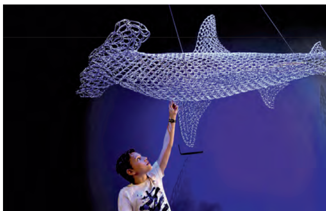
'Hamerhaai', 2019 door Vincent Mock in de tentoonstelling 'Dit zijn wij!'

overleggen plaats met leerkrachten en icc-ers in verband met voorbereidingen en aanpassingen van lessen en projecten op maat.