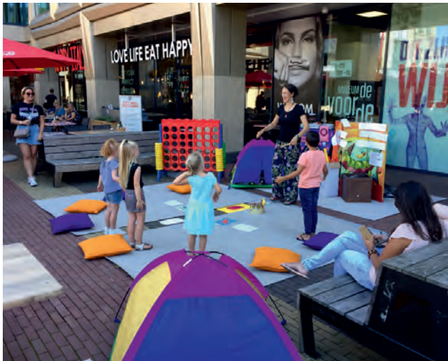
Kinderactiviteit i.h.k.v. CultuurZomer op het Zomer in 't Hart terras