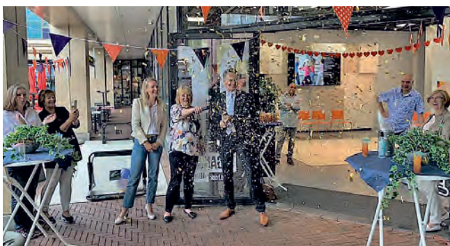
Opening Zomer in 't Hart terras op 8 juli

Door de coronamaatregelen heeft het museum in 2020 maar enkele zakelijke ontvangsten kunnen faciliteren.