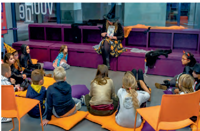
Griezelmiddag voor kinderen i.s.m. Bibliotheek Zoetermeer

In juli 2020 heeft Museum De Voorde drie gastworkshops gegeven voor de Artlabs van CKC & Partners, in de wijken Meerzicht, Oosterheem en Seghwaert. De workshops vonden buiten plaats. Er kon lekker geknoeid worden tijdens het maken van een eigen salt painting .