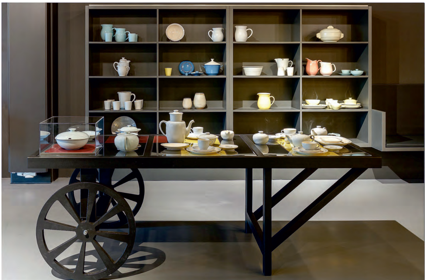
Tentoonstelling 'Fris op tafel'

bezoekers het rampenjaar 2020 ludiek afsluiten door de dingen die ze wilden vergeten op een beschadigd bordje te schrijven en dat stuk te gooien om 2021 fris te beginnen. Helaas is dit door de lockdown alleen nog door het museumteam gedaan (waarvan op social media verslag is uitgebracht).