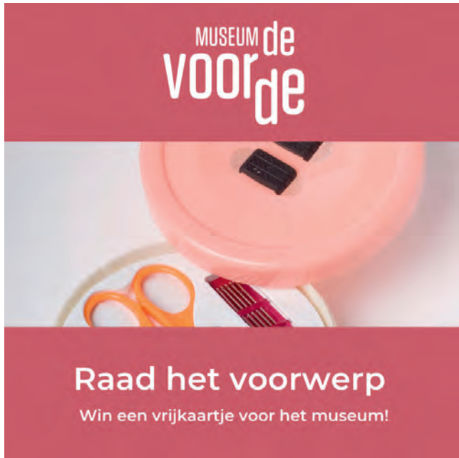
Afbeelding voor 'Raad het voorwerp-actie' op Instagram