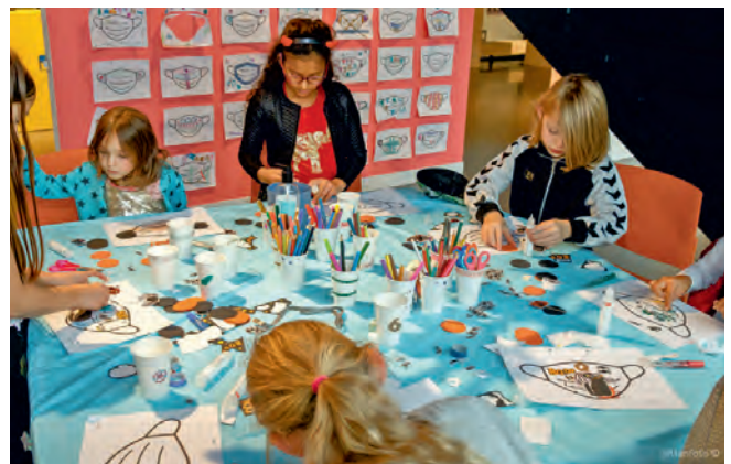
Mondkajes versieren die daarna opgehangen werden op de rode wand.