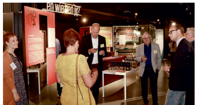
Floravontuur Businessborrel op 23 september