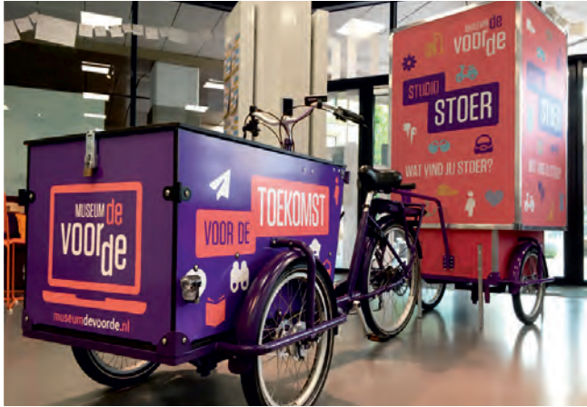
Educatiebakfiets en Studio Stoer