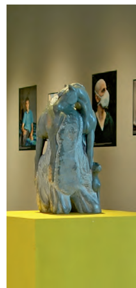
Tentoonstelling 'Stoere Helden tijdens Corona'