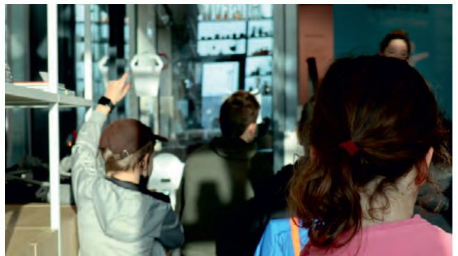
Museuminspectie door leerlingen van SBO De Horizon

Leerlingen van SBO De Horizon bezochten Museum De Voorde in het kader van hun projectweek. Tijdens deze projectweek maakten zij zelf een tentoonstelling op school. In Museum De Voorde kwamen zij inspiratie opdoen en een 'museum inspectie' uitvoeren: ze werden hierbij uitgedaagd om zelf dingen te bedenken die in de tentoonstelling 'Stoere Helden tijdens Corona' verbeterd zouden kunnen worden.