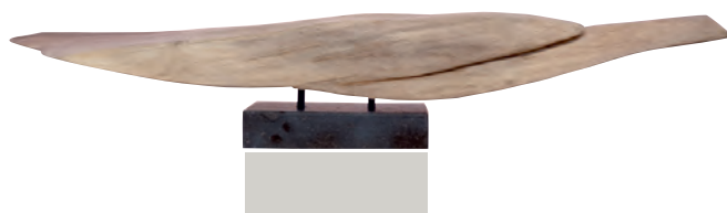
Kunstwerk 'Zoals het stroomt' door Marijke Wijgerinck in de tentoonstelling 'Stoere Helden tijdens Corona'