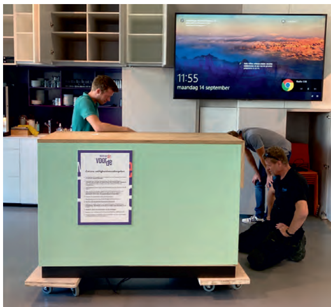
Verplaatsing informatie- en kassabalie van de entree aan het Zuidwaarts naar het Museumplein aan het Stadhuisplein

In de week voor de opening van de tentoonstelling 'Stoere Helden tijdens Corona' is de balie van het museum verplaatst naar de ingang aan het drukbezochte Stadhuisplein. Een logisch besluit ten aanzien van de zichtbaarheid van het museum en de geplande bouw van een woontoren naast de voormalige entree aan het Zuidwaarts die in