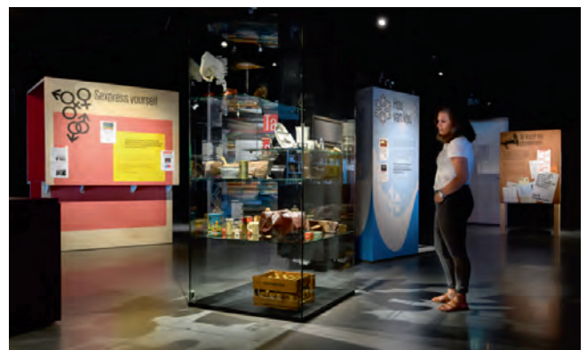
Tentoonstelling '...en wie ben jij?'