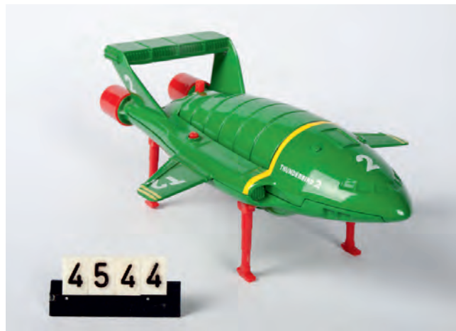
Nieuwe aanwinst collectie Thunderbirds

Op 24 juni verscheen in het Algemeen Dagblad een paginagroot artikel over de pop-uptentoonstelling '75 jaar Vrijheid - 75 jaar Humanitas'. Onze conservator deed tevens een oproep tot samenwerking voor toekomstige pop-uptentoonstellingen.