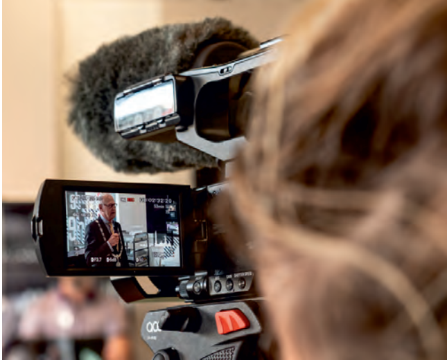
Filmopname voor Omroep West tijdens de opening van de tentoonstelling 'Stoere Helden tijdens Corona'

uit te lichten. Op 20 september verscheen een spread in het Algemeen Dagblad over de opening van de tentoonstelling. Hiermee introduceerden de kranten het project bij een groot publiek. Bereik per editie: 19.200 mensen woonachtig in de regio (krant + online).