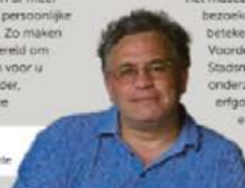
Column Hans van de Burde